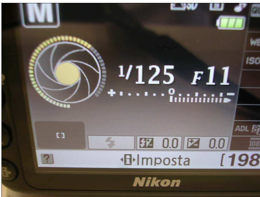
Impostare il tempo di esposizione su 1/125 sec ed il diaframma su F11/16