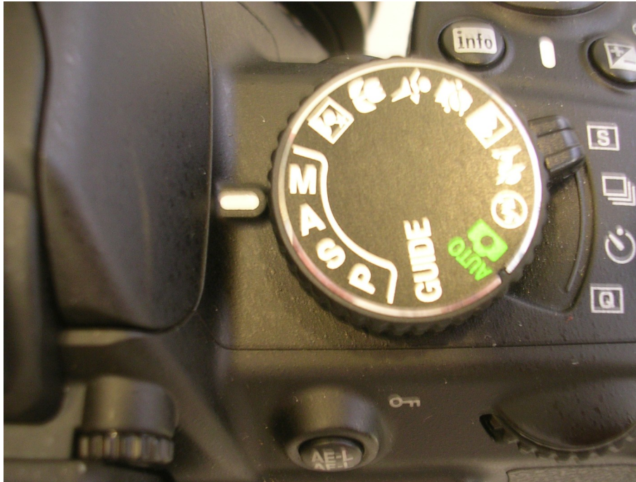
Impostare la fotocamera in modalità "Manuale"