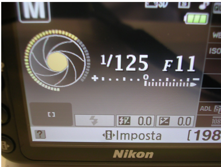
Impostare il tempo di esposizione su 1/125 sec ed il diaframma su F11/16